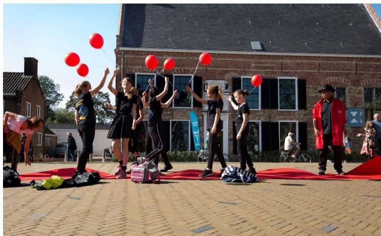
Jeugd Theaterschool Noordenwind tijdens seizoen opening 2020